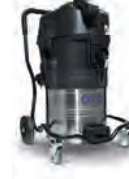
IVB7X - ATEX