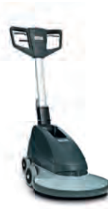
BU500 Geniş alanlarda parlak yüzeyler için