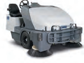
SW8000 Geniş alanların süpürülmesi için ideal. Suyla toz kontrolü özelliği