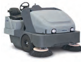
SR 1601 İnce tozlar için endüstriyel çözüm