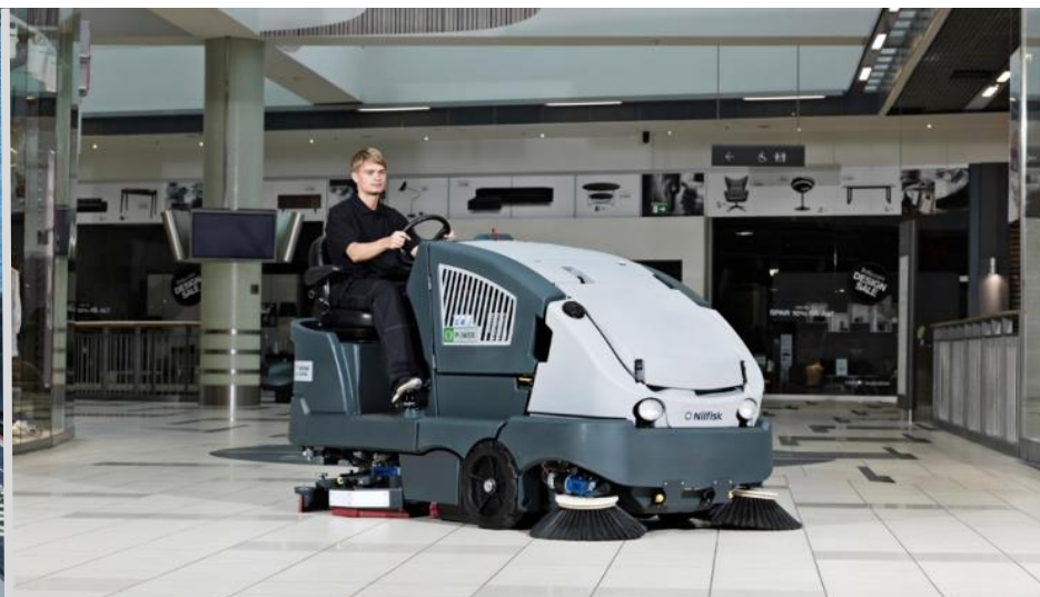
デパート・ショッピングセンター 駅ターミナルなどの公共施設