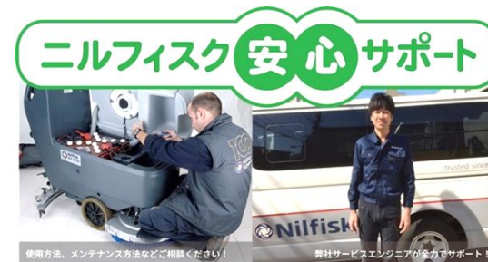
高い技術力で万全サポート