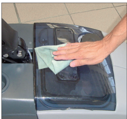
16. Reinigen Sie die Maschine mit einem feuchten Tuch und verwenden, wenn nötig, ein neutrales Reinigungsmittel.