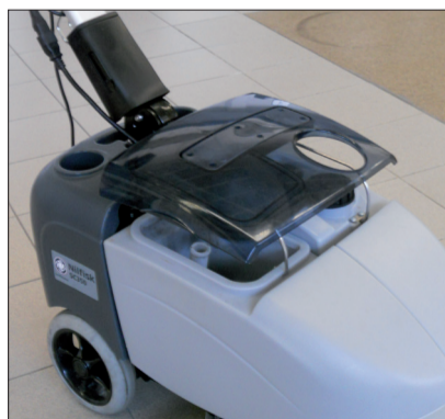
18. Parken Sie die Maschine mit geöffnetem Tankdeckel.

Sollte die Scheuersaugmaschine bis zum Aufleuchten der roten LED-Anzeige des Batterie-Ladezustands in Betrieb gewesen sein, ist eine Voll-Ladung der Batterie (10–12 Stunden) unbedingt erforderlich. Ein fehlerhafter Ladezyklus (kürzer als 10–12 Stunden) kann der Batterie Schaden zufügen. Das Aufladen der Batterie nach jedem Gebrauch ist empfehlenswert.