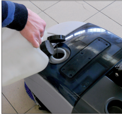
2. Befüllen Sie den Frischwassertank mit Wasser/Reinigungslösung, passend für den jeweiligen Boden und die gewünschte Reinigung.