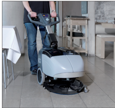
8. Wiederholen Sie Abb. 6. Falls zu viel Wasser/Reinigungslösung aufgetragen wird, passen Sie die Menge wie in Abb. 7. beschrieben an.