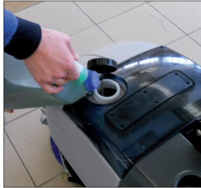
3. Beachten Sie die Anwendungshinweise für das Reinigungsmittel und füllen Sie keine Flüssigkeiten über 40°C ein.