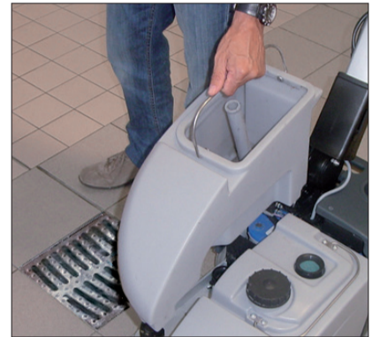
10. Nach Beendigung des Reinigungsvorgangs unbedingt den Schmutz- und Frischwassertank entleeren.