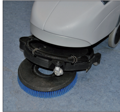
4. Platzieren Sie die Bürste unter dem Schrubdeck.