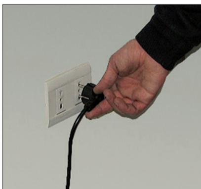
17. Laden Sie die Batterien.