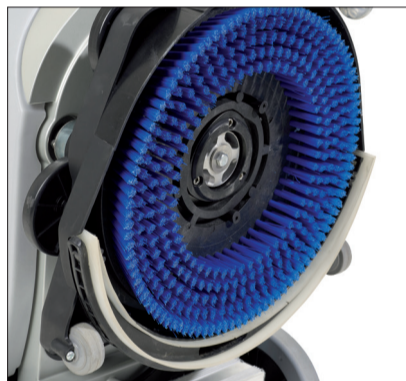
13. Nehmen Sie die Bürste bzw. das Pad ab und reinigen Sie es.