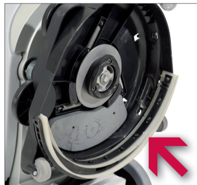
14. Entfernen Sie die Saugleiste und alle Verschmutzungen.