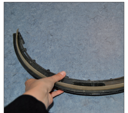
15. Überprüfen Sie die Sauglippen auf Beschädigung (ggf. austauschen).