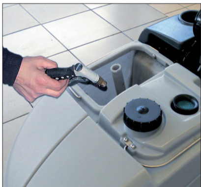
11. Reinigen Sie anschließend den Schmutzwassertank.