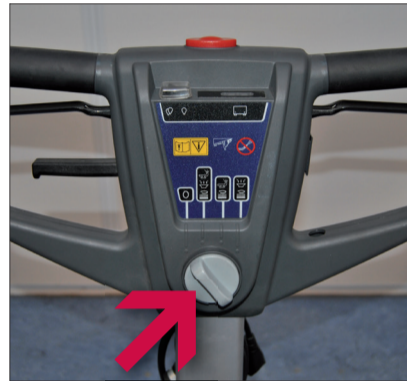
9. Drehschalter auf „0“ stellen um die Maschine auszuschalten.