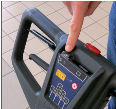
7. Wählen Sie die Wassermenge durch Drücken der Taste.