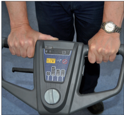
6. Betätigen Sie den roten Sicherheitsschalter zusammen mit den beiden Griff-Hebeln, um die Maschine zu starten. Der Sicherheitsschalter kann hiernach wieder losgelassen werden.