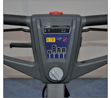
5. Drehschalter auf die gewünschte Anwendung drehen.