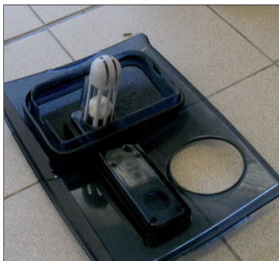
12. Spülen Sie den Deckel und das Gitter mit Frischwasser ab.