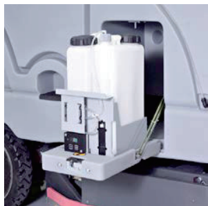
自動洗剤希釈装置(オプション)

使用する清水量/洗剤量を節約し、少ない環境負荷で効率的な清掃を実現。 汚れの状態に合わせて清水のみ、洗剤少量モード、最大洗浄力モードを スイッチ一つで選択可能。