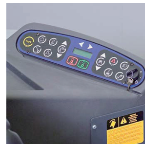
ワンタッチ操作パネル