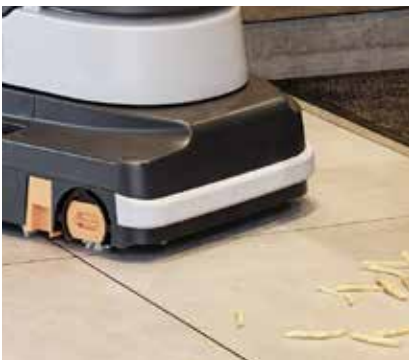
Leichtes Aufnehmen von Grobschmutz, da sich der vordere Saugfuß anheben lässt