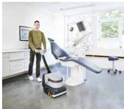
Gründliche Reinigung, die die Hygienestandards von Kliniken und Krankenhäusern erfüllt.