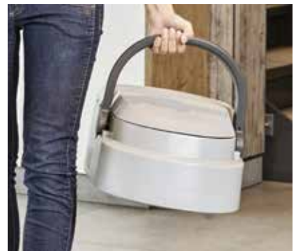
Das Tank-in-Tank-System vereinfacht die Handhabung beim Leeren und Nachfüllen