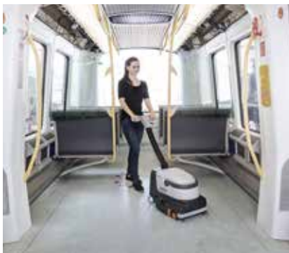
Leicht zu manövrieren dank Lenkrollen und ergonomischem, verstellbarem Schubbügel.