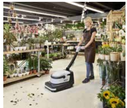
Böden leicht und schnell reinigen – gleichzeitig kehren, scheuern und saugen.