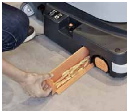
Der Grobschmutzeinsatz ist zum Leeren und Reinigen gut zugänglich