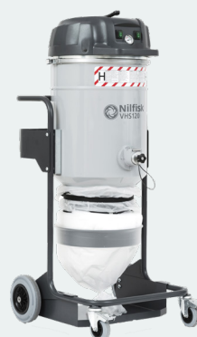
VHS120 (ロンゴパック®仕様)