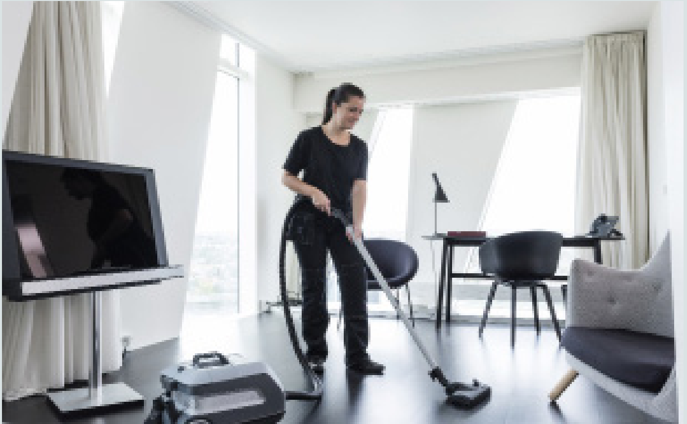
El galardonado e innovador aspirador VP600 ofrece unos resultados de limpieza superiores. Gracias a su bajo nivel de ruido, esta máquina es ideal para la limpieza diurna en hoteles y restaurantes.