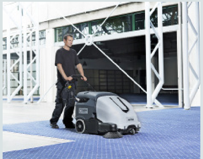
Para las zonas enmoquetadas con mucho tráfico, como salas de conferencias y pasillos, el silencioso y potente aspirador SW900 ofrece un alto rendimiento de limpieza y productividad.

Una cartera de más de 125 soluciones de limpieza