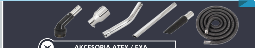
AKCESORIA ATEX / EXA