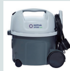
VP300 HEPA 本体 107406530