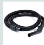
ホースコンブ リート 147 0765 500