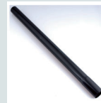
エクステンション チューブ (2本) 140 8246 040