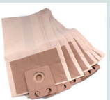
ペーパーバッグ (1枚のみ) 140 8618 000