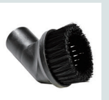
ブラシノズル 140 8244 500