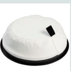
サックフィルター 147 1432 500