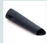
クレビスノズル 147 0146 500