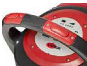
Comutator de siguranță integrat ergonomic. Fiecare comutator poate fi acționat independent