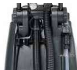
Furtun pentru golire ușoară