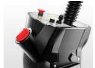
Deșurbați capacul roșu și umpleți cu apă