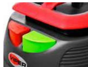
Buton ECO pentru a regla puterea de aspirație și a reduce zgomotul