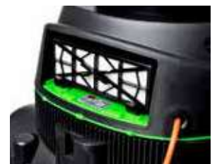
Configurația standard conține filtrul HEPA