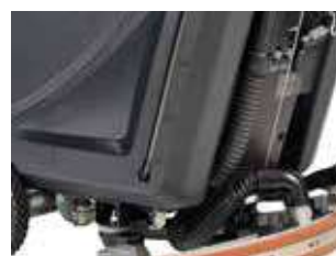
Indicator de nivel al apei pe rezervor