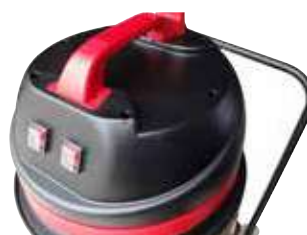
Manevrarea ușoară datorită mânerului ergonomic cu cârlig pentru cablu, două butoane separate cu funcții de pornire / oprire