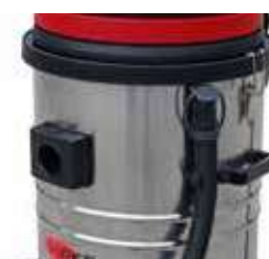
Furtun de evacuare pentru o mai ușoară golire a tancului