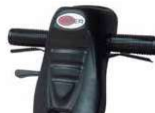
Măner și comenzi proiectate ergonomic