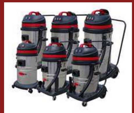
Familia de produse LSU are un design modular, cu diverse capacități ale containerului și cu un număr diferit de motoare în funcție de mărimea aspiratorului