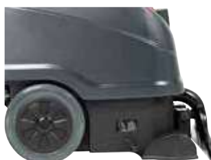
Roți mari pentru transport ușor