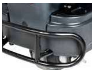
Bara de protecție frontală, protejează aparatul și îi asigură echipamentului o durată de viață mai mare