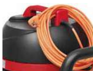
Suport de cablu pentru o depozitare ușoară