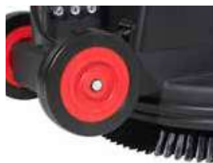
Roțile mari din spate facilitează transportul și asigură o bună manevrabilitate