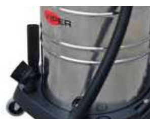
Stocarea ușoară a accesoriilor