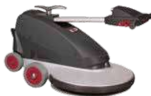
Mâner pliabil pentru o depozitare ușoară, economie a spațiului și ușurința în transport