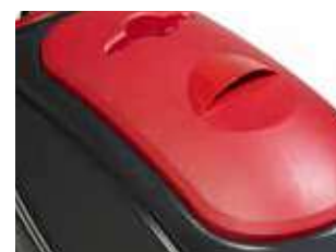
Curățarea simplificată a rezervorului de recuperare, datorită capacului mare al rezervorului