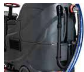
Sistemul de agățat racleta pe bazinul de apă murdară ajută la deplasarea mașinii prin zone înguste