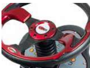
Tabloul de bord intuitiv, cu buton tactil și meniu ușor de utilizat pentru setările de operare