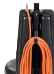
Cârlig de metal robust pentru înfășurarea în siguranță a cablului de alimentare