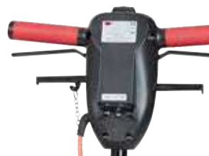
Mâner ergonomic, reglabil pe înălțime, cu buton central de siguranță maneta de comandă pentru rezervorul de detergent