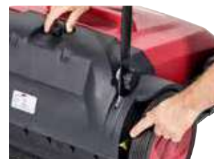
Perie principală ajustabilă