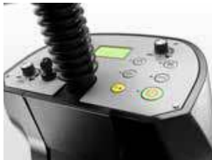
Activarea tuturor funcțiilor cu o apă sare de buton