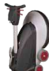
Posibilitate de depozitare în poziție verticală