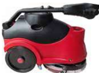
Măner pliabil pentru o depozitare usoara