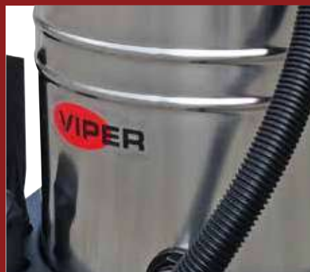
Echipamente puternice și eficiente, cu container din inox sau plastic - fiabile și robuste