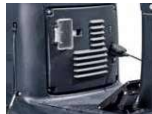
Incarcator integrat pentru o usoara alimentare a bateriei