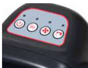
Panoul de control cu 4 functii usor de folosit