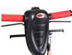
Mâner ergonomic, reglabil pe înălțime, cu buton central de siguranță și maneta de comandă pentru rezervorul de detergent