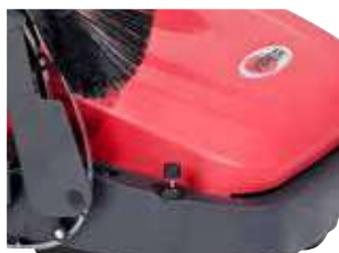
Ajustarea periei principale