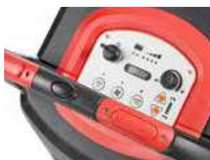
Panou de control cu afișaj intuitiv