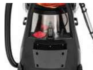
Rezervorul de apă curată integrat în șasiu