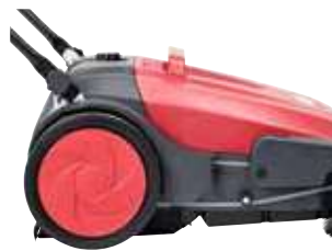
Roți mari ce nu lasă urme