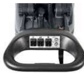
Mâner ergonomic ajustabil