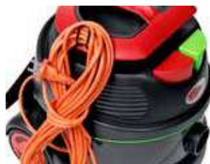
Support cablu pentru o depozitare ușoară