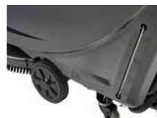
Ușor de utilizat și transportat datorită roților mari care echilibrează mai bine echipamentul