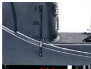
Indicatorul de nivel al apei vizibil pe rezervor