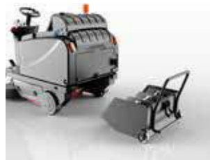
Container cu roți, opțional cu 3 mini-containere