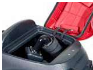
Deschiderea largă a bazinului de recuperare de 73 de litri îl face ușor de curățat