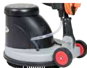
Paternic, motor robust și roți mari pe spate pentru transport facil