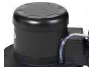
Angrenaj planetar triplu, motor silentios