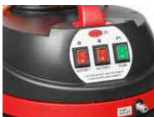
Acționare cu o singură apăsare pentru ușurință în utilizare