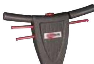
Mâner ergonomic, reglabil pe înălțime cu comutator de siguranță pe centru, ușor de utilizat