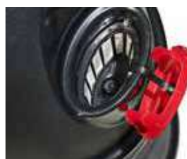
Alimentarea cu apă se face prin deschiderea ovală mare cu filtru și capac de protecție