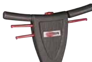
Mâner ergonomic, reglabil pe înălțime cu, comutator de siguranță pe centru, ușor de utilizat