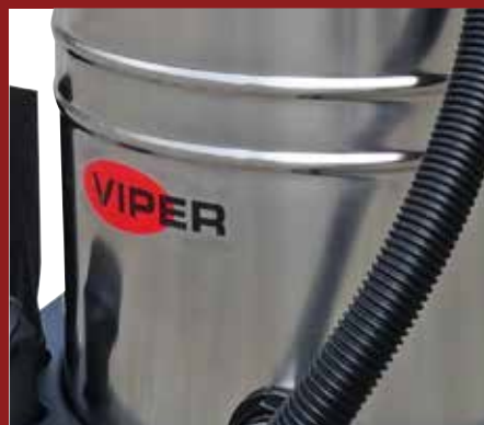
Echipamente puternice și eficiente, cu container din inox sau plastic - fiabile și robuste