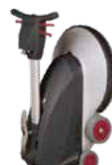
Posibilitate de depozitare în poziție verticală