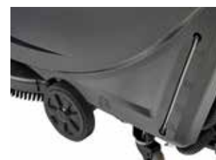
Ușor de utilizat și transportat datorită roților mari care echilibrează mai bine echipamentul