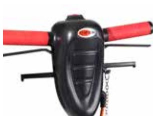
Mâner ergonomic, reglabil pe înălțime, cu buton central de siguranță și maneta de comandă pentru rezervorul de detergent