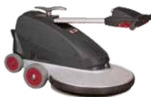
Mâner pliabil pentru o depozitare ușoară, economie a spațiului și ușurinta în transport