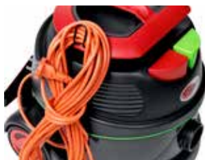
Support cablu pentru o depozitare ușoară