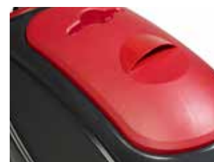
Curățarea simplificată a rezervorului de recuperare, datorită capacului mare al rezervorului