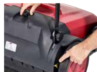
Perie principală ajustabilă