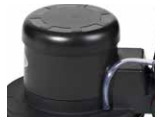
Angrenaj planetar triplu, motor silentios