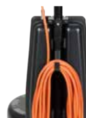
Cârlig de metal robust pentru înfășurarea în siguranță a cablului de alimentare