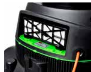
Configurația standard conține filtrul HEPA