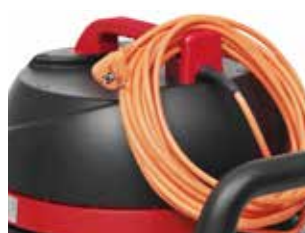
Suport de cablu pentru o depozitare usoara