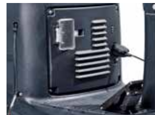
Incarcator integrat pentru o usoara alimentare a bateriei