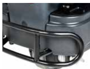
Bara de protecție frontală, protejează aparatul și îi asigură echipamentului o durată de viață mai mare