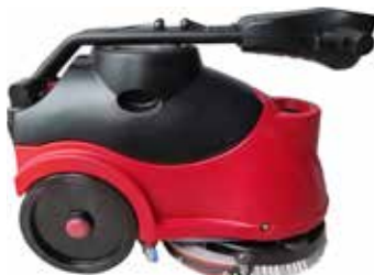
Maner pliabil pentru o depozitare usoara