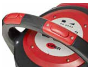
Comutator de siguranță integrat ergonomic. Fiecare comutator poate fi acționat independent