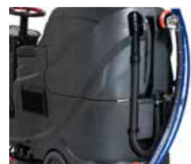
Sistemul de agățat racleta pe bazinul de apă murdară ajută la deplasarea mașinii prin zone înguste