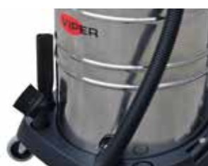
Stocarea ușoară a accesoriilor