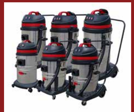
Familia de produse LSU are un design modular, cu diverse capacități ale containerului și cu un număr diferit de motoare în funcție de mărimea aspiratorului