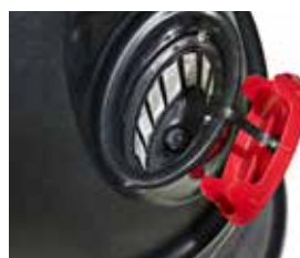
Alimentarea cu apă se face prin deschiderea ovală mare cu filtru și capac de protecție