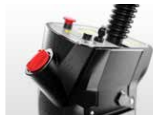
Deșurbați capacul roșu și umpleți cu apă