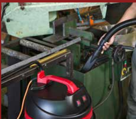
Adecat pentru lucrări solicitante, în special în medii dificile și umede