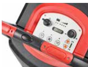
Panou de control cu afișaj intuitiv