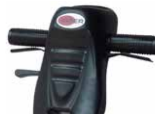
Măner și comenzi proiectate ergonomic