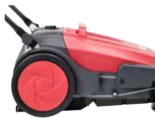
Roți mari ce nu lasă urme