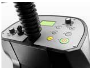
Activarea tuturor funcțiilor cu o apăsare de buton