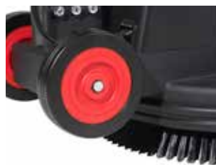
Roțile mari din spate facilitează transportul și asigură o bună manevrabilitate