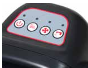
Panoul de control cu 4 functii usor de folosit