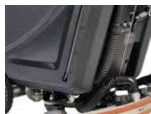
Indicator de nivel al apei pe rezervor