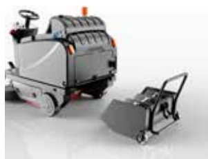
Container cu roți, opțional cu 3 mini-containere