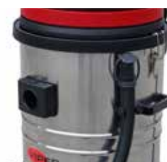
Furtun de evacuare pentru o mai ușoară golire a tancului