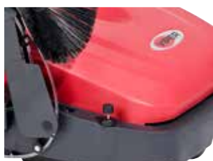
Ajustarea periei principale