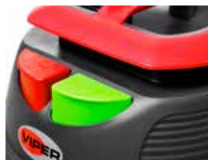
Buton ECO pentru a regla puterea de aspirație și a reduce zgomotul