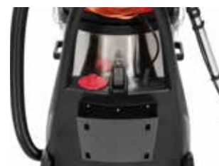
Rezervorul de apa curata integrat in sasiu