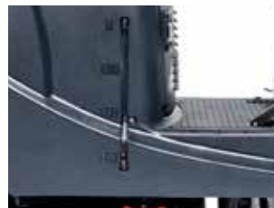
Indicatorul de nivel al apei vizibil pe rezervor