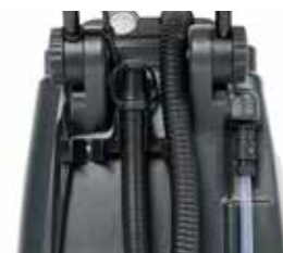
Furtun pentru golire ușoară