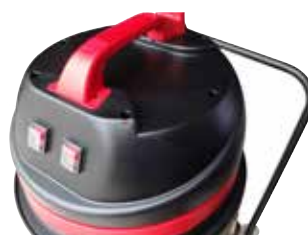
Manevrarea ușoară datorită mânerului ergonomic cu cârlig pentru cablu, două butoane separate cu funcții de pornire / oprire