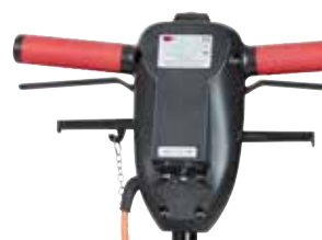
Mâner ergonomic, reglabil pe înălțime, cu buton central de siguranță maneta de comandă pentru rezervorul de detergent