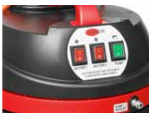
Acționare cu o singură apăsare pentru ușurință în utilizare