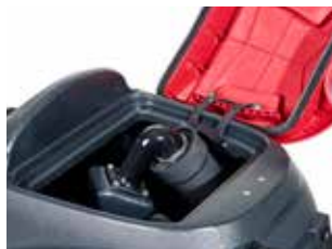
Deschiderea largă a bazinului de recuperare de 73 de litri îl face ușor de curățat