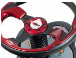
Tabloul de bord intuitiv, cu buton tactil și meniu ușor de utilizat pentru setările de operare